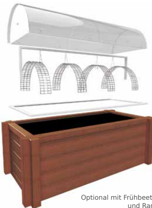
Optional mit Frühbeetaufsatz und Rankgitter